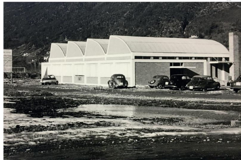
Sede dei Saleggi 1956