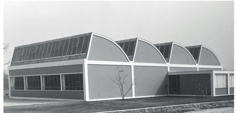
Sede dei Saleggi (Innovation Factory)

Un valore aggiunto per la città di Losone e per il Ticino.